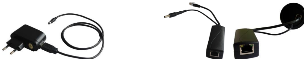
Obr.1 – Možnosti napájení radonové sondy (síťový adaptér a PoE splitter)

Základem sondy je měřicí komora s polovodičovým detektorem. Radon vstupuje do komory difuzí přes vstupní filtr ve dně sondy. Sonda autonomně nepřetržitě měří a zpracovává výsledky (kontinuální monitor). Sonda si ukládá do vnitřní paměti časové záznamy hodnot koncentrace radonu, včetně hodnot teploty a vlhkosti (typicky v intervalu 1 hodina). Dále jsou do paměti sondy časově zaznamenávány také naměřená energetická spektra (typicky v intervalu 12 hodin). Sonda se umísťuje do libovolného místa v měřené místnosti, zpravidla děrovaným dnem dolů, ale není to podmínkou. Dno sondy nesmí být ničím zakryté. Díky potřebě stálého napájení ze síťového adaptéru 230VAC/5VDC nebo ze systému PoE je sonda určena především pro stálou instalaci a dlouhodobý monitoring koncentrace radonu. Pro případ náhlého výpadku napájení sonda zálohuje běh reálného času v zařízení tak, aby při obnově napájení byly pořizovány záznamy s korektním datem a časem.