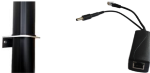
Držák sondy PoE splitter

RadonView – PC aplikace pro snadné prohlížení záznamů a spekter změřené radonové koncentrace (soubory .tab) ke stažení na webových stránkách SÚRO (Státní Ústav Radiační Ochrany) ( https://www.suro.cz/en/prirodnioz/suro-software-data-processing-from-continuous-rn-monitors )