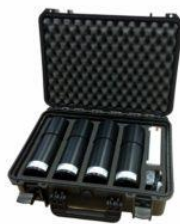
Vodotěsný kufr pro 4 sondy a příslušenství